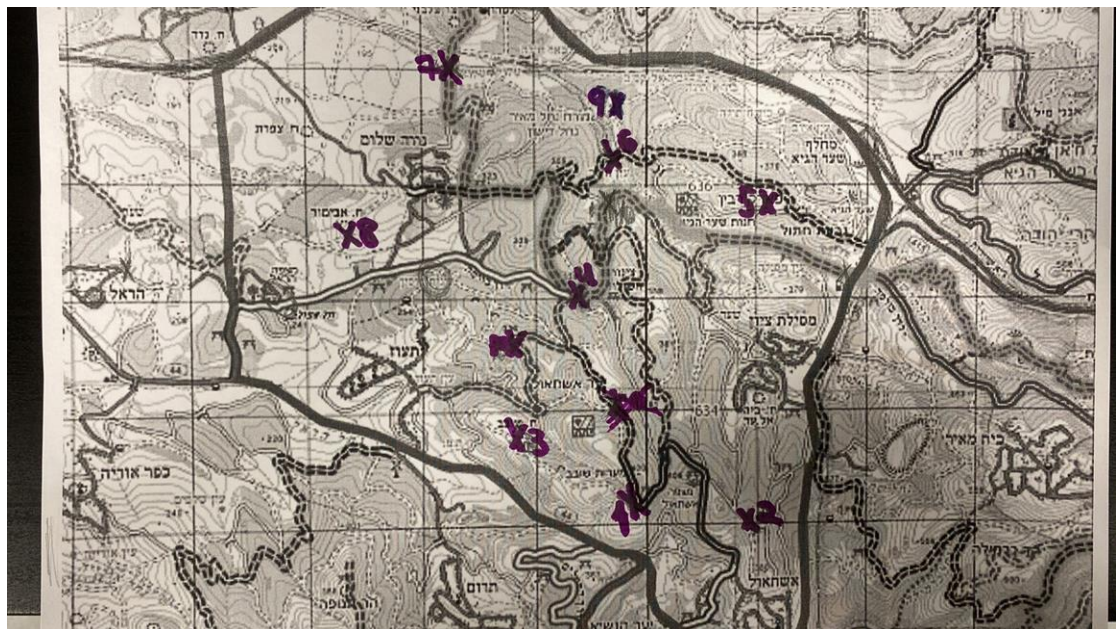
1. מצפה שירי 2. חניון קק"ל 3. חניון שובב 4. ספריית שביל ישראל 5. פארק רבין